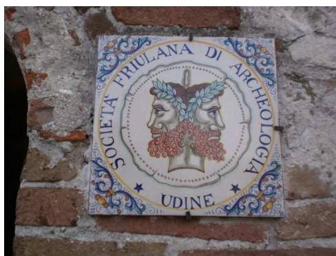
L'insegna all'ingresso della Sede di Porta Villalta

Società Friulana di Archeologia onlus Sede operativa: TORRE DI PORTA VILLALTA – Via Micesio, 2 – 33100 UDINE Tel./Fax 0432.26560