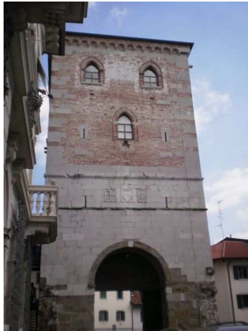
La Torre di Porta Villalta – Sede della Società Friulana di Archeologia